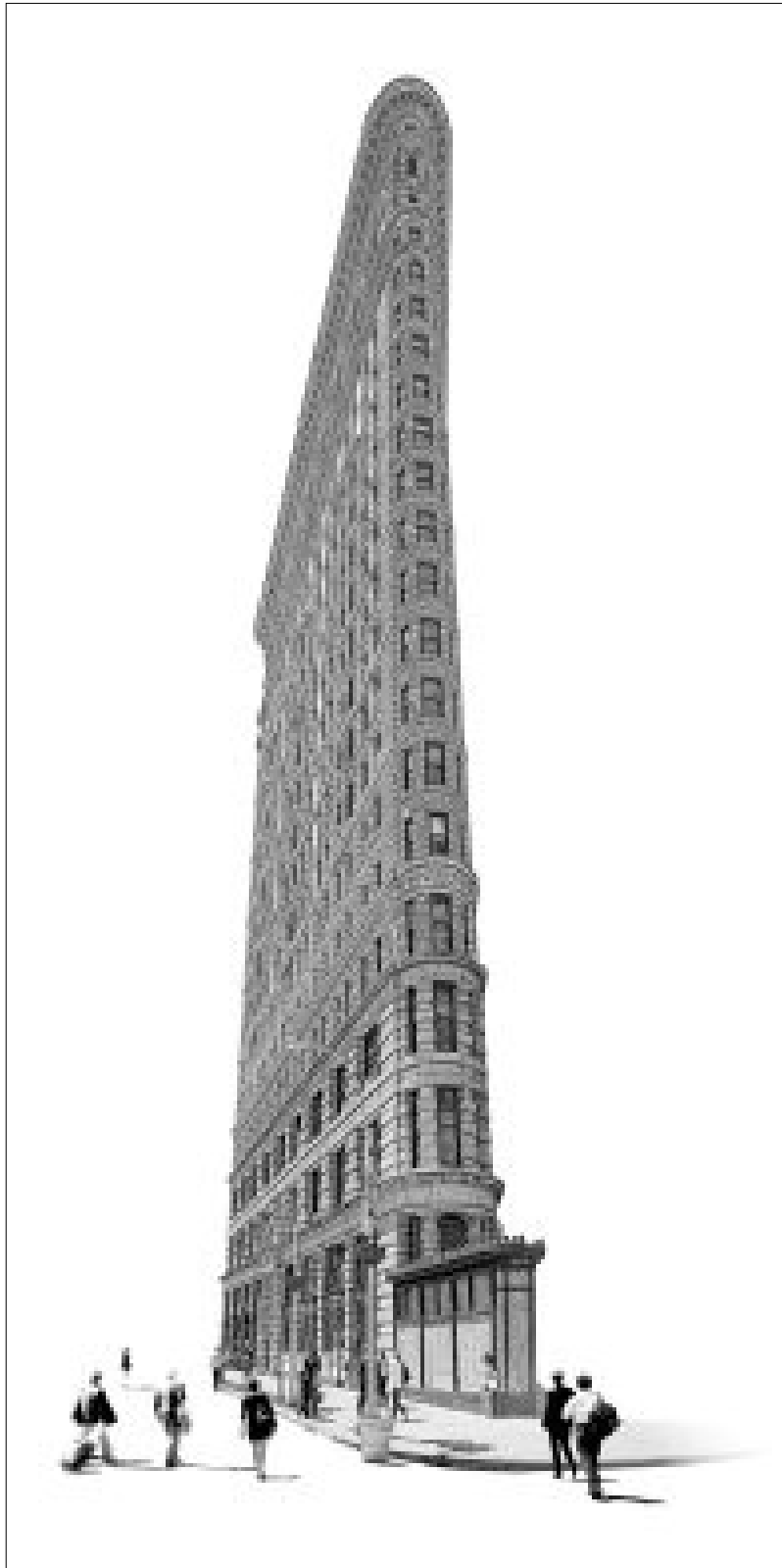
FlatIron I Tirage C-print sous diasec - 30 exemplaires 180x90cm