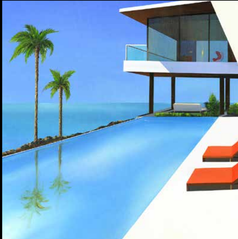
Rayon de soleil Technique mixte sur toile - Mixed media on canvas 90x90cm - 35x35inch