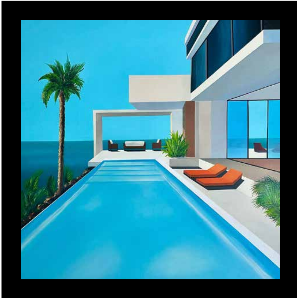
In ocean view the air is clear Technique mixte sur toile - Mixed media on canvas 100x100cm - 39x39inch