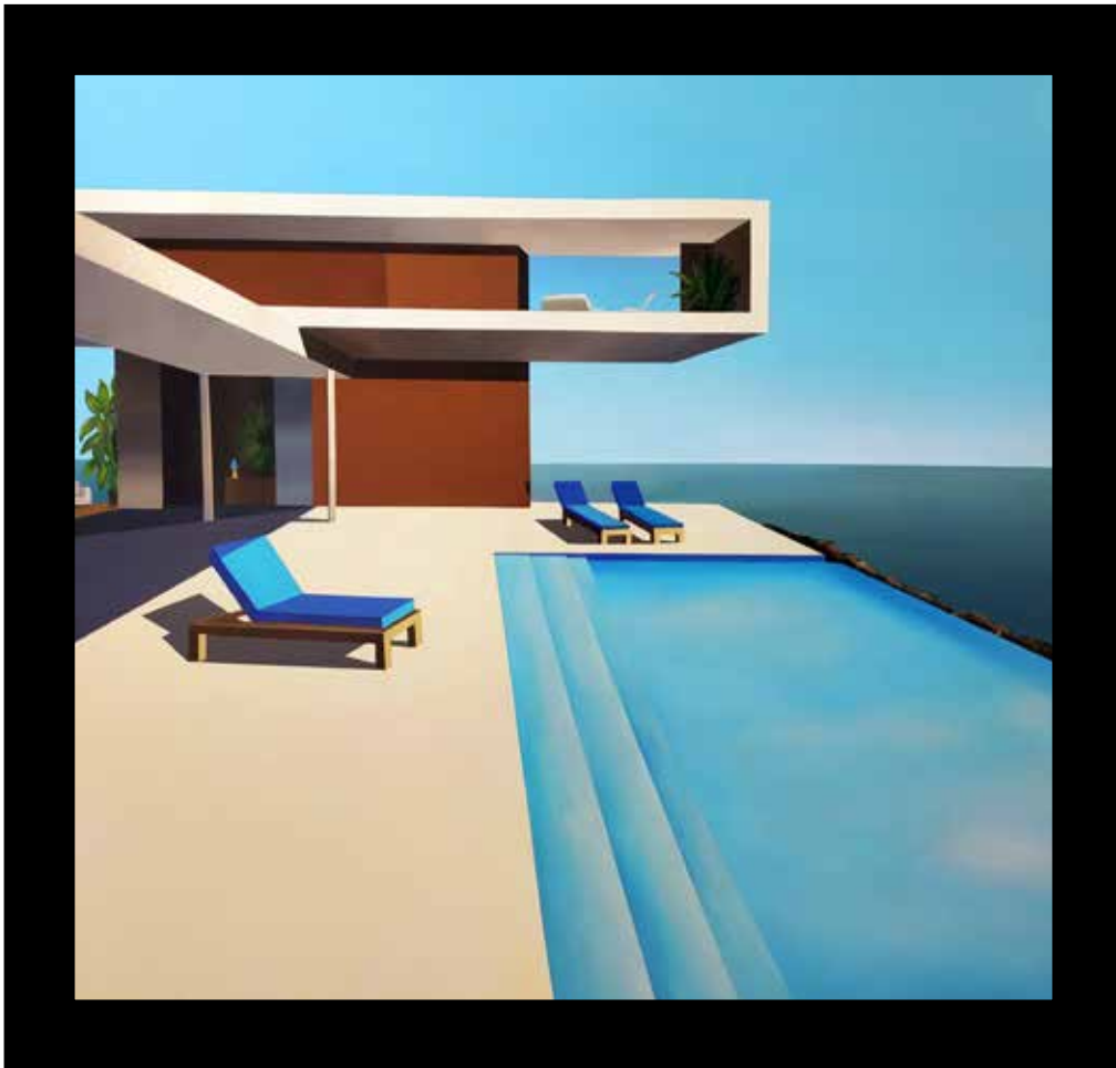
Heaven place II Technique mixte sur toile - Mixed media on canvas 112x107cm - 43,7x41,8inch