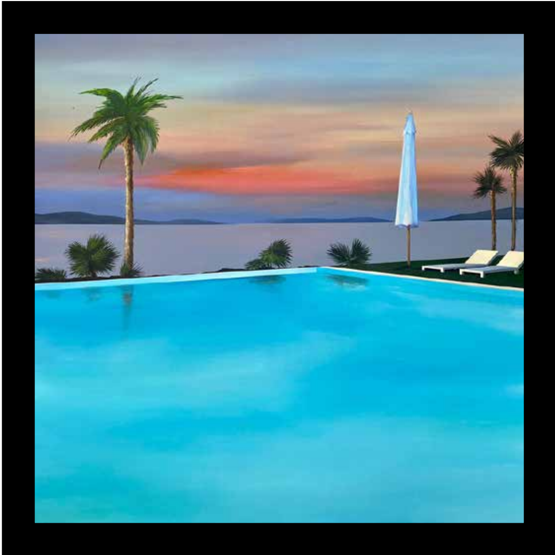
Summer evening and dancing skies Technique mixte sur toile - Mixed media on canvas 112x112cm - 44x44inch