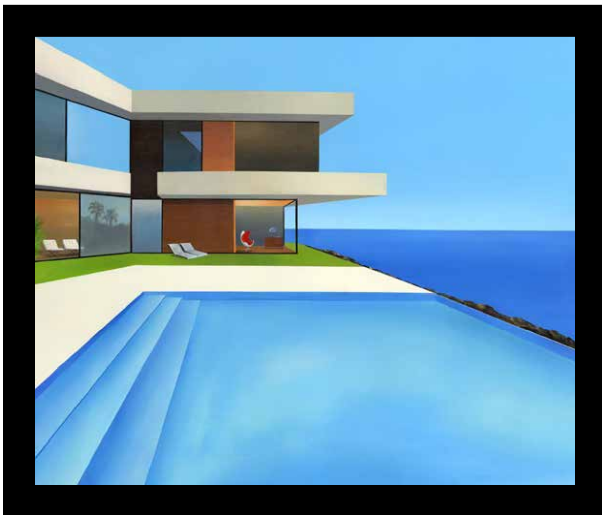
Deep in the ocean's blue Technique mixte sur toile - Mixed media on canvas 106x127cm - 42x50inch