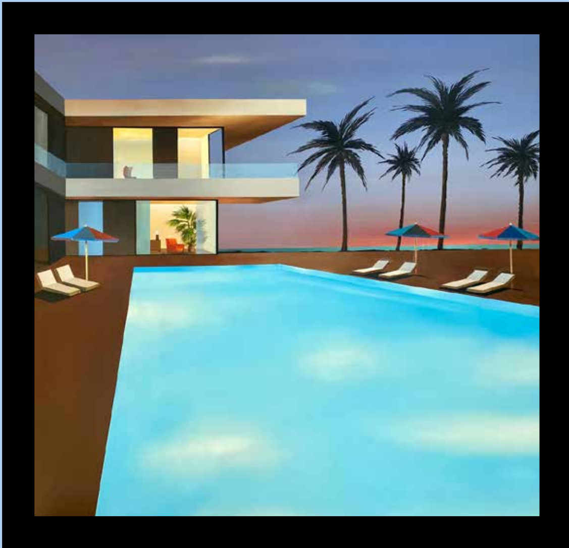
A red sky lights up the night Technique mixte sur toile - Mixed media on canvas 107x102cm - 42x44inch