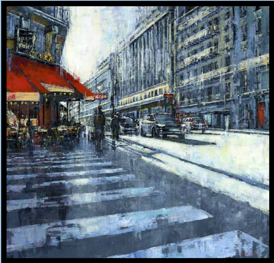
Café du métro, Paris Technique mixte sur toile - Mixed media on canvas 100x100cm - 39x39in