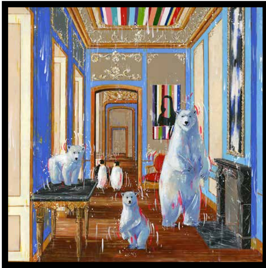
A Visit from the North Pole Technique mixte sur toile - Mixed media on canvas 100x100cm - 39x39in