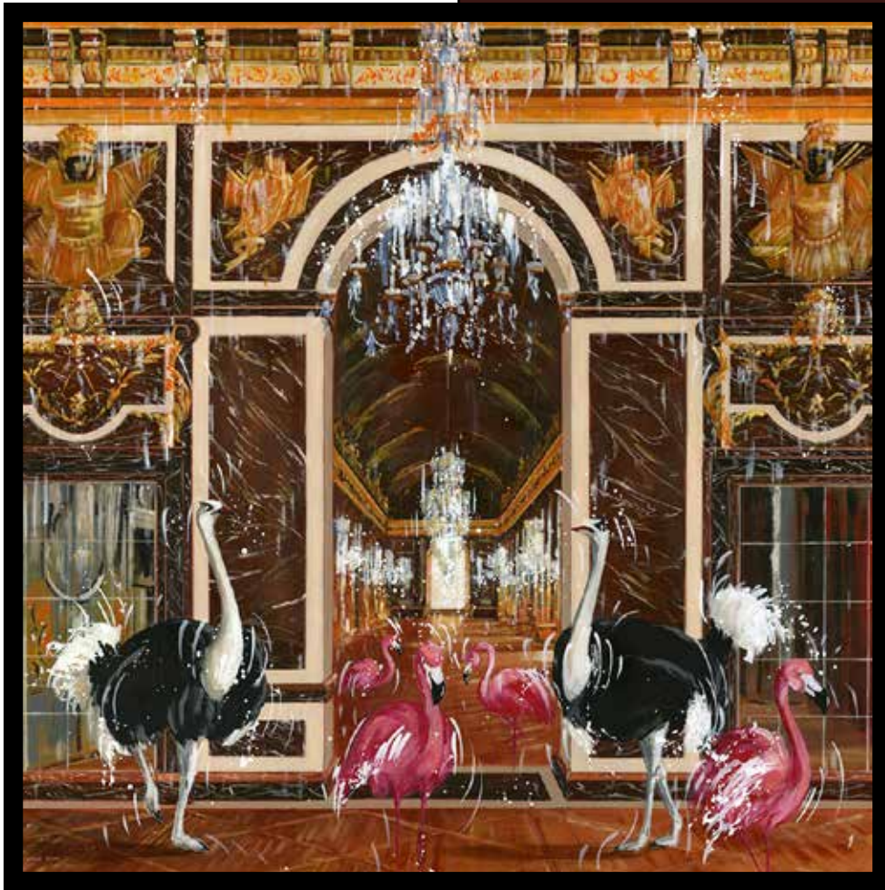
Dans la cour de Versailles Technique mixte sur toile - Mixed media on canvas 100x100cm - 39x39in