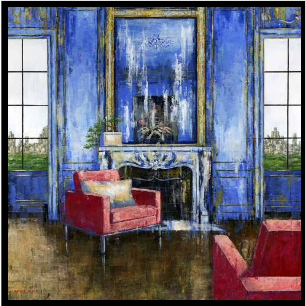
Panoramic Central Park View Technique mixte sur toile - Mixed media on canvas 80x80cm - 31,2x31,2in