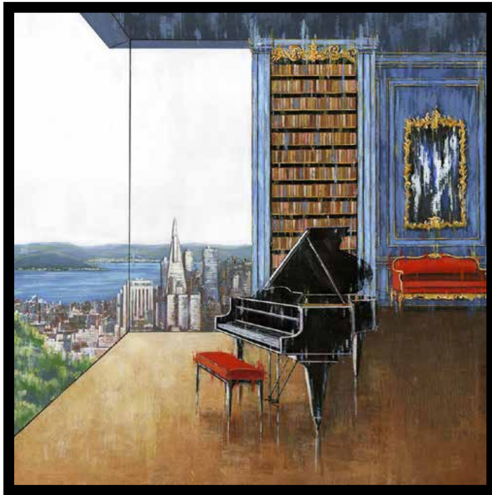
A piano and San Francisco

Technique mixte sur toile - Mixed media on canvas