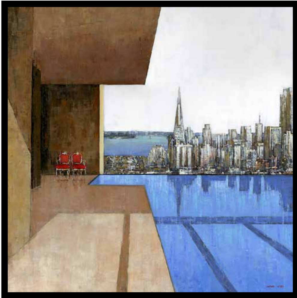
Vue sur San Francisco Technique mixte sur toile - Mixed media on canvas 100x100cm - 39x39in