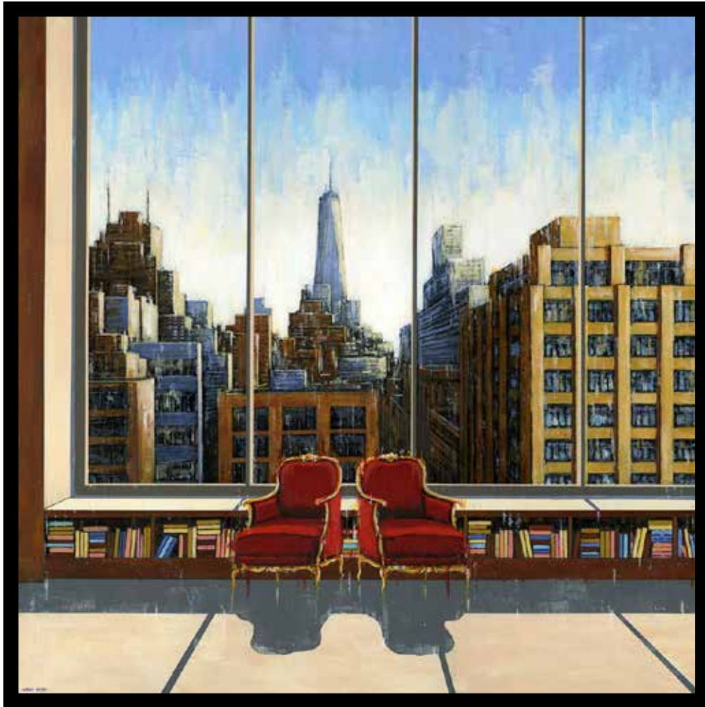
YOLO in Soho Technique mixte sur toile - Mixed media on canvas 100x100cm - 39x39in