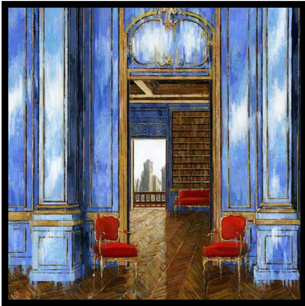
Flat Iron view

Technique mixte sur toile - Mixed media on canvas